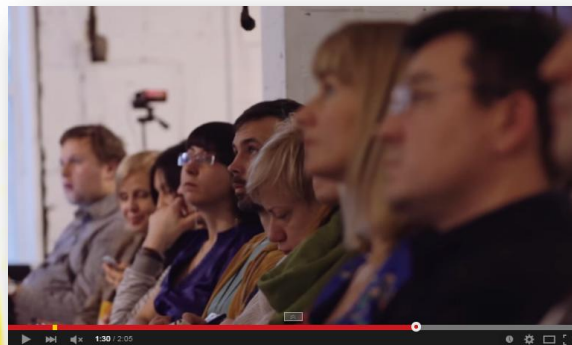
CRMclub II (11.12.2014)